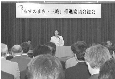
5月9日 三鷹産業プラザ