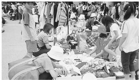
▶当日、直接会場へ。 →消費生活係 ☎内線2545

午前10時～午後2時30分 市役所中庭で 小雨の場合は翌6月1日(日)に延期 (1日も雨の場合は中止)