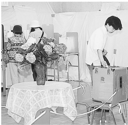
貴重な一票を無駄にしないで

課税内線2391へ。 ◆納税には、安心・便利な口座振替をご利用ください。お申し込みは、保険課(市役所1階9番窓口)、各市政窓口、指定金融機関、郵便局へ①納税通知書、②預金通帳の届出印、③預金通帳をお持ちください。 ↓保険課内線2391