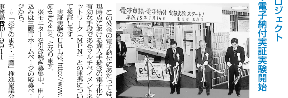
この公金の電子納付にあたっては、現時点における蔵入手続きの電子化に有効な手段であるマルチペイメントネットワーク(MPN)との連携について検証します。

「あすのまち・三鷹」プロジェクトの一つで、全国初の公金の電子納付実証となる電子申請・施設予約・電子納付実証実験がいよいよ始まりました。1月14日には、市役所1階の指定金融機関前で実験関係者によるテープカット(写真)が行われ、電子申請・電子納付のデモンストレーションが行われました。