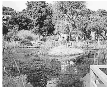
新川丸池公園(新川5-1-8)