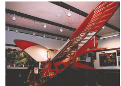
「三鷹の森ジブリ美術館」で10月から新企画展