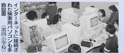
インターネットに接続された検索用パソコンも多数設置 (第四小学校)