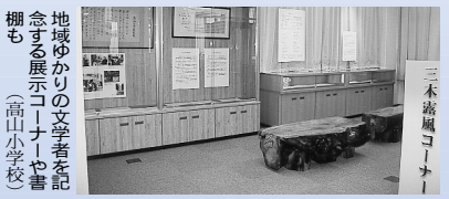
地域ゆかりの文学者を記念する展示コーナーや書棚も (高山小学校)

定・貸出・整理などを主な仕事とし、教師と連携して授業をサポートすることもあります。こうした整備により、学校図書館を利用する児童・生徒数や、貸し出し冊数が大幅に増加するなど、大きな成果を上げています。このような学校図書館整備は、平成13年度までに17校で行われ、今年度は第二小学校・第六小学校・第七小学校・第五中学校・第七中学校の5校で実施予定です。これにより、すべての市立小・中学校の学校図書館整備が完了することになります。