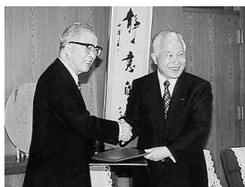
合意書を取り交わす安田市長と北城格太郎日本IBM会長(右)

おはよう!三鷹市です FMむさしの78.2MHz 月~金曜日10:20~25放送