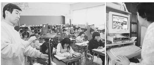
イントラネットを使った授業の実況中継(三小で)

※イントラネット インターネットの技術を利用した企業・組織などで使われるネットワーク・情報システム。パスワードなどによってアクセスする人間を限定することができる。