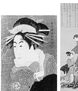
東洲斎写楽「初代松本米三郎の化粧粧少将 実は松下道酒之進娘しのぶ」大判錦絵

ジェノバ出身の彫刻師エドアルド・キヨッソーネは1875年来日しました。24年にわたる日本滞在の間に収集した浮世絵は4,000点におよびます。今回の企画展では、現在ジェノバ市立キヨッソーネ東洋美術館が所蔵するこれらの作品の中から肉筆画約40点、版画作品110点などを展示し、キヨッソーネの人物像にも迫るものです。