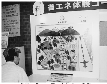
牟礼コミュニティセンターの省エネ体験コーナー