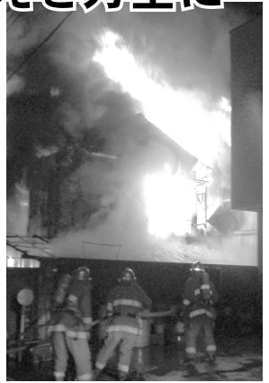
3月9日深夜の野崎地区での火災

新聞などでみなさんご存知のことと思いますが、3月6日(内)午後4時30分ごろ、市内野崎地区で全焼火災が発生し、さらに11日(月)には小金井市、調布市で火災があり、これらも放火が原因と疑われています。 この日は、午後2時30分ごろ、小金井市緑町で発生した火災を皮切りに、夕方までに野分寺、小金井、三鷹、武蔵野の4市にわたり、連続放火をほさむ南北で合計5件の連続放火が発生しました。これらはいずれも、建物の陰で目につくにくい場所から出火しているという共通点があります。 また、3月9日(日)深夜には、市内野崎地区で全焼火災が発生し、さらに11日(月)には小金井市、調布市で火災があり、これらも放火が原因と疑われています。 火災は、一瞬にして人の財産を失わせるだけでなく、人々の生命をも危険にさらす恐ろしい災害といえます。とりわけ意図的に火をつける放火という行為は、反社会的な犯罪行為であり、断じて許すわけにはいきません。しかし、火災の出火原因のうち放火が第1位というのが現実です。 警察・消防など関係機関では、犯人捜査や原因の特定に