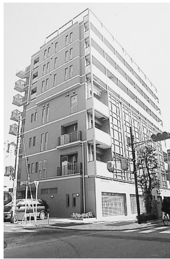
三鷹市中央通りタウンプラザ