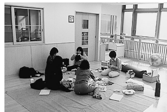
開設準備の進む子育て支援施設