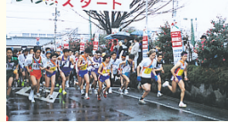
三鷹市駅伝大会成績発表