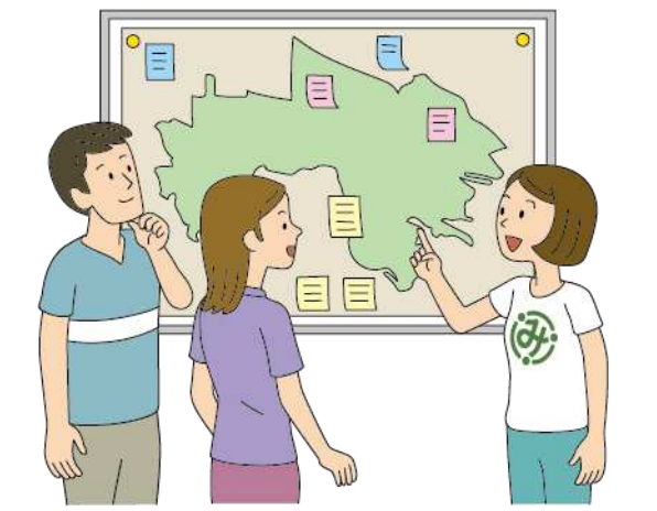
共助に参加してくれる人財の育成