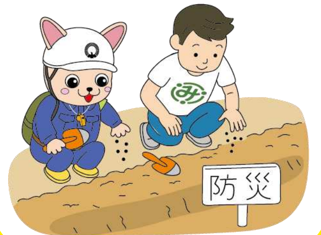
防災意識の啓発(種まき)