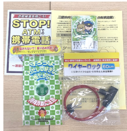
令和3年度キャンペーンの配布グッズ (透明袋に入れて配布)