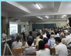
◆熊本県立大学 島谷特別教授からの講演