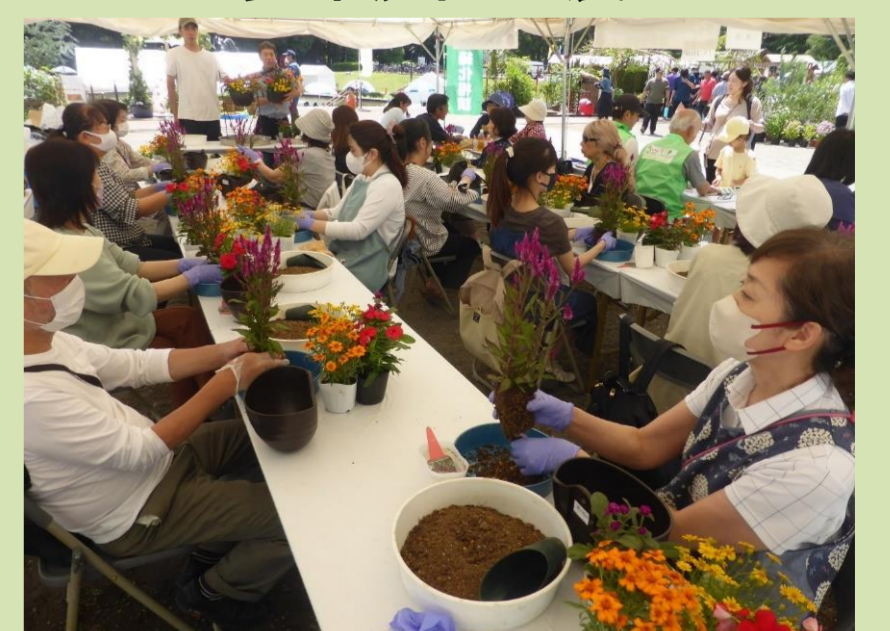
季節の寄せ植えづくり講習会

庭づくり体験、コンテナガーデンコンテスト、子どもに人気のツリークライミング体験、園芸緑化資材や花苗販売なども行いました。