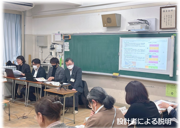
設計者による説明