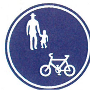
「普通自転車等及び歩行者等専用」標識

特例特定小型原動機付自転車以外の電動キックボード等は、路側帯や歩道を通行できません。