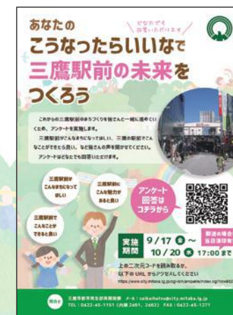
▲実施したアンケートのお知らせ

昨年9月中旬～10月20日に実施した三鷹駅前地区のまちづくりに関するアンケート調査の集計・分析結果がまとまりました。また、アンケートに回答いただいた事業者の方で、協力いただける方を対象にヒアリングを実施し、さらに詳しい意見を伺いました。今回は取組の実施状況、集計・分析結果の一部や今後の取組の方向性などについて、お知らせします。