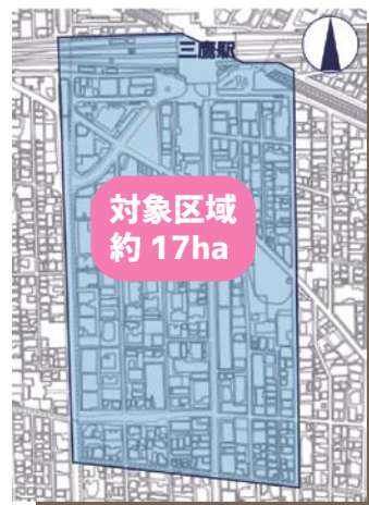
▲基本計画の対象区域

今回の調査結果から、いくつかのテーマ、またテーマごとの今後の方向性が見えてきましたので紹介します。今後は「新三鷹駅前地区再開発基本計画（仮称）」の策定に向け、結果を基礎資料として活用し、三鷹駅前地区のまちづくりを進めていきます。