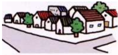
住宅地域イメージ図