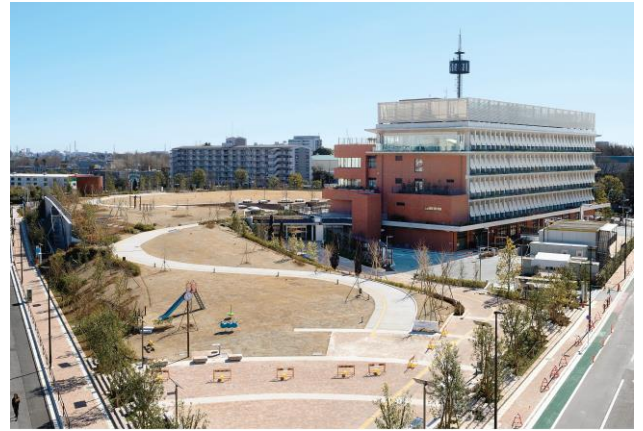
三鷹中央防災公園・元気創造プラザ