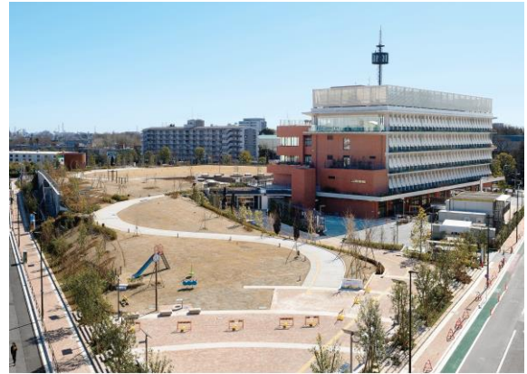
三鷹中央防災公園・元気創造プラザ