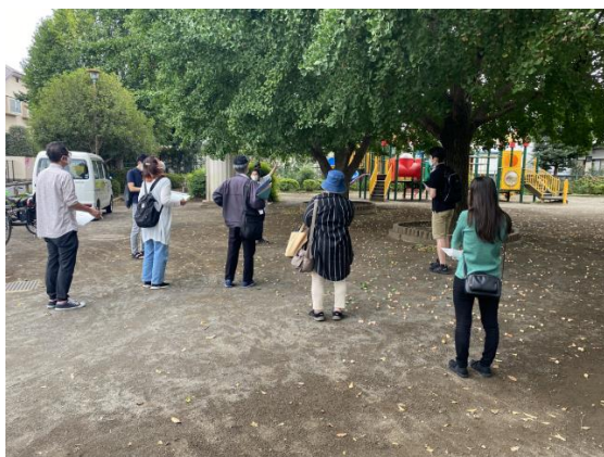
《牟礼ひばり野児童公園》