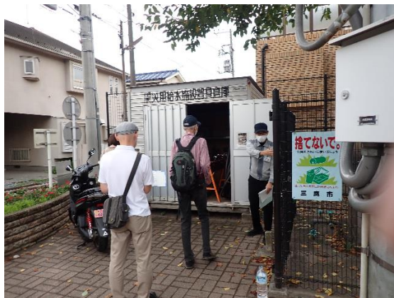
震災用給水施設器具倉庫