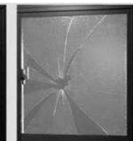
フィルム:あり フィルム:なし