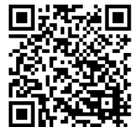
베이비시터 이용 지원 사업 (임시 보육 이용 지원)