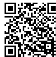
育儿人员 利用支持事业 (临时托育利用支持)