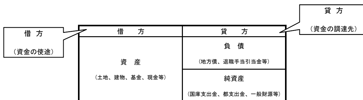
【図－3】 貸借対照表の構造

なお、自治体の貸借対照表では民間企業における「資本」という概念がなく、「純資産」と表現し、これまでの世代がすでに負担した金額を表しています。また、負債は、これからの世代が今後負担していく金額を表しています。