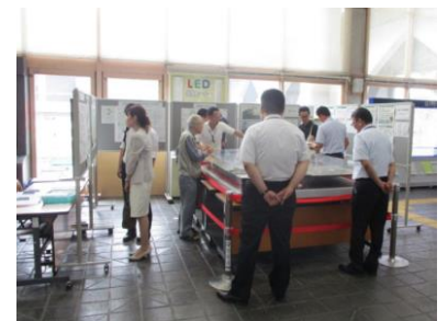
市民ホールでの模様