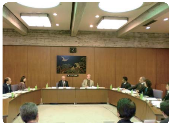
みたか国際化円卓会議