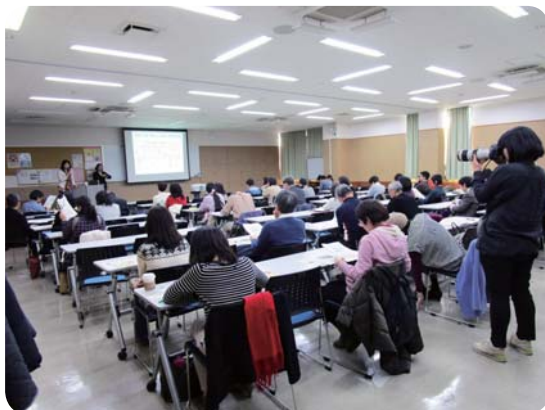
ワーク・ライフ・バランス講座