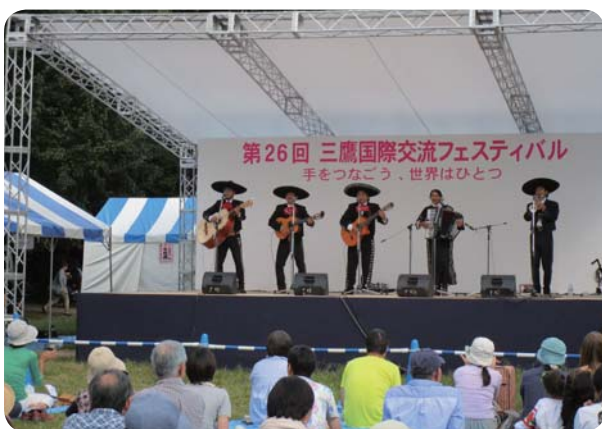
三鷹国際交流フェスティバル

平成16年1月に市と三鷹国際交流協会の間で締結した防災パートナーシップ協定に基づき、国際交流センターの防災情報拠点としての機能強化とともに、災害時・緊急時対応のための広域的な連携強化を図ります。