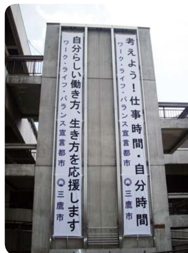
ワーク・ライフ・バランス懸垂幕 (市役所)