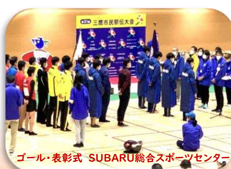
ゴール・表彰式 SUBARU総合スポーツセンター