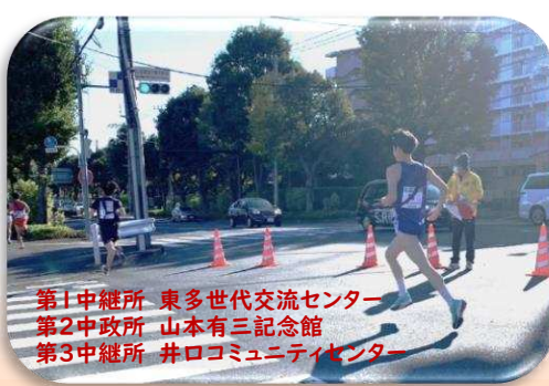
第1中継所 東多世代交流センター 第2中継所 山本有三記念館 第3中継所 井ロコミュニティセンター