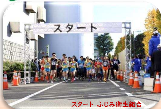
スタート ふじみ衛生組合

小春日和の穏やかな天候のもと 全12.3kmを125チームが襷をつなぎ 全チームが完走しました