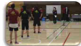
審判の説明に耳を傾ける