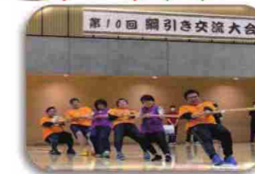
第10回 綱引き交流大会