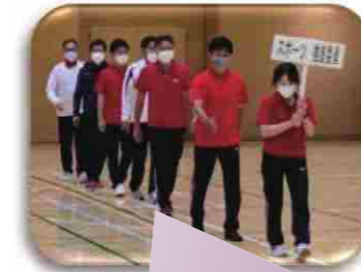
エキシビジョンマッチに出場したスポーツ推進委員選抜チーム