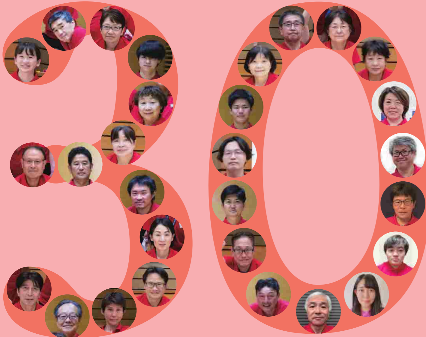
※SPORTS30は三鷹市のスポーツ推進委員の定数です