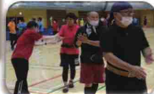
手指消毒も念入りに