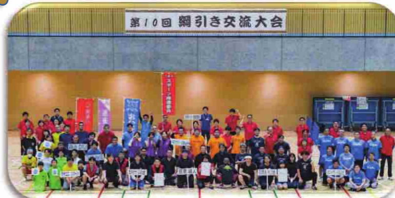
第10回 綱引き交流大会