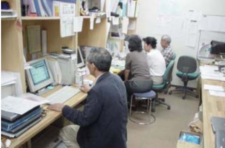
都市活性化の新たな担い手として期待されるSOHO事業者。 地域活性化支援型コミュニティビジネスも始まっている。