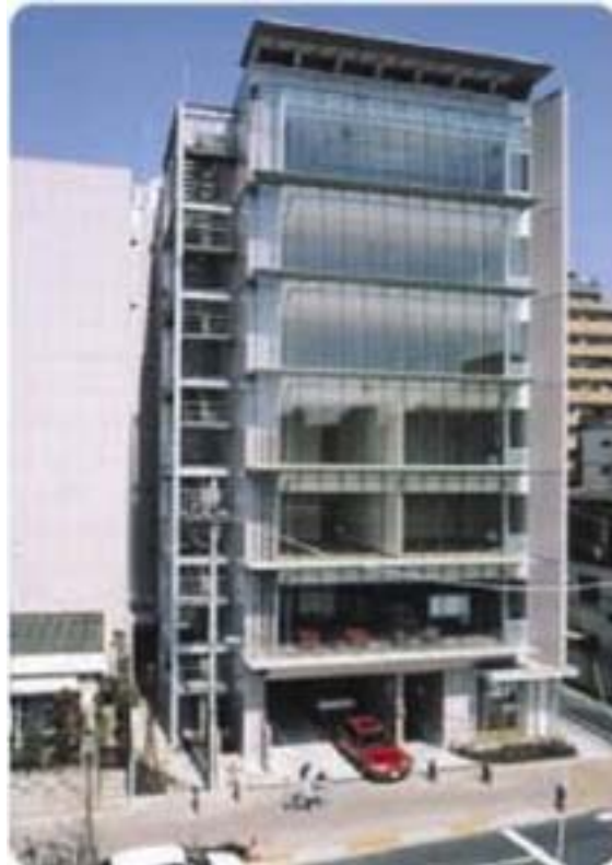
産業振興の拠点、中心市街地活性化の拠点施設「三鷹産業プラザ」