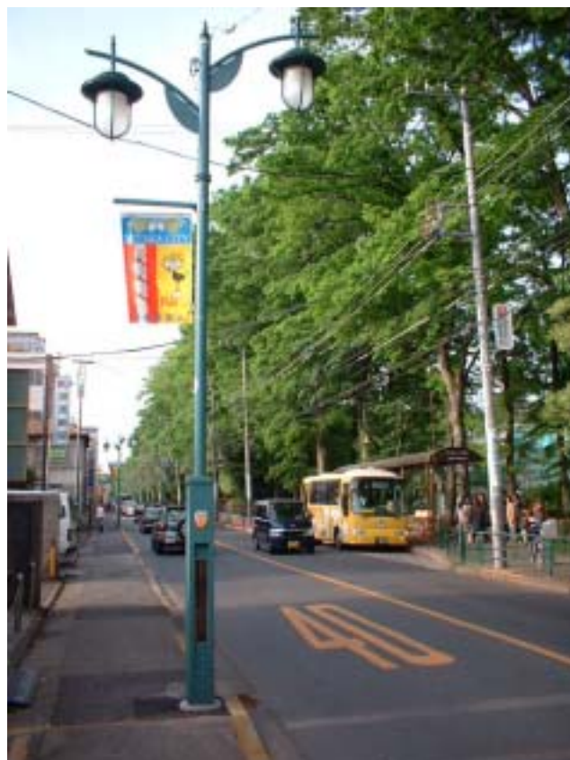
ジブリ美術館の協力で完成した商店街街路灯