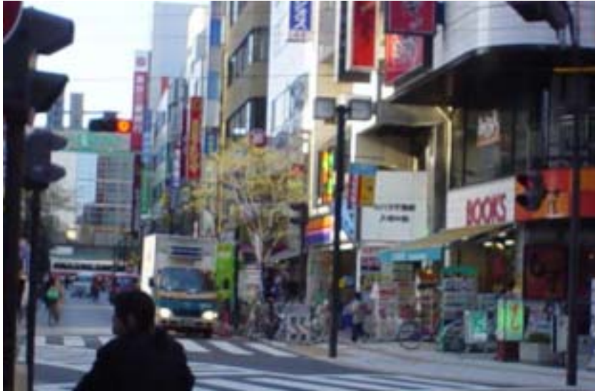
バリアフリー対応が進む三鷹駅前中心市街地