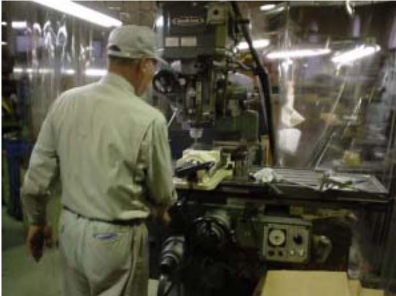
高度な技術と技能が生きる三鷹のものづくり