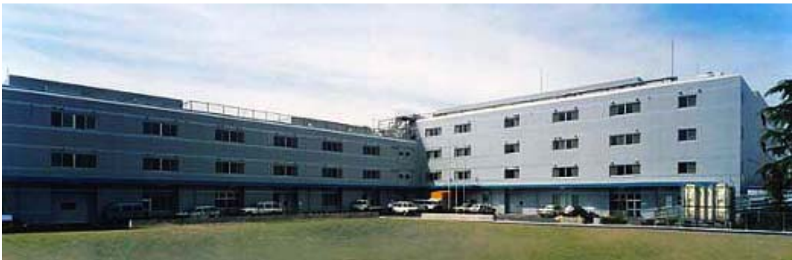
都市型工業の集団化事業として、海外からの視察も多い三鷹ハイテクセンター