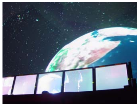
図1 国立天文台 4D2U の目標