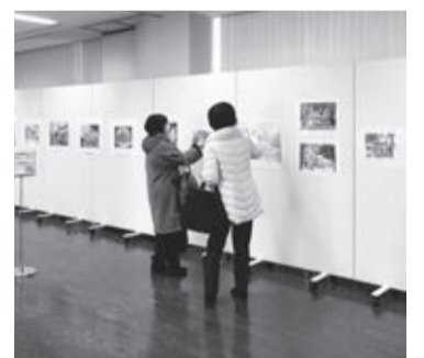
コンテスト会場の様子