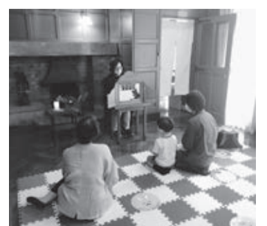
おはなし会の様子