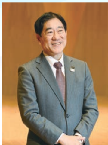
三鷹市長 河村 孝