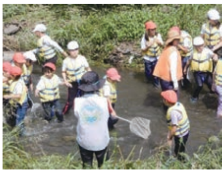
地域と学校との交流の状況

子育て研究所での検討を進めるとともに、「スクール・コミュニティ推進委員会(仮称)」を設置するなど、多様な地域団体などと連携しながら、子どもたちの活動を地域で支える仕組みを構築します。