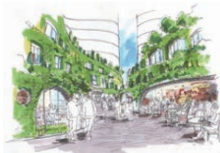
三鷹駅前再開発のイメージコンセプト

防災力の向上を図り、成熟した都市の質的向上に取り組みます。中核となる三鷹駅南口中央通り東地区再開発では、三鷹駅前地区を対象とした『新三鷹駅前地区再開発基本計画(仮称)』の策定に向け、アンケートやヒアリング等の意向調査、ワークショップなどを行います。また、地権者などとの合意形成を図りながら、市の方針として『三鷹駅前再開発に関する基本プラン(仮称)』を策定し、令和5年度の都市計画決定を目指します。