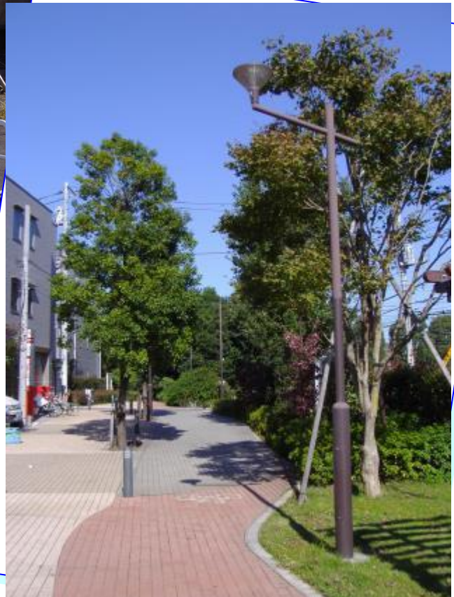
都市計画道路整備のイメージ写真