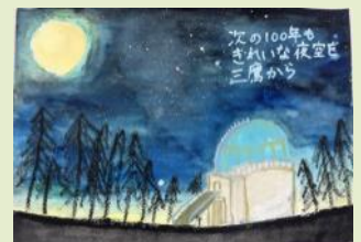
教育長賞：荒堀 明花(第四小 六年)