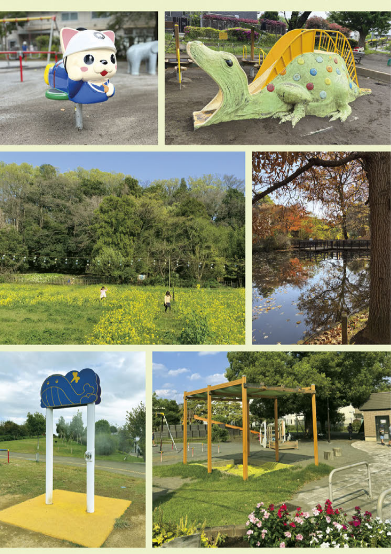
三鷹市緑と公園課