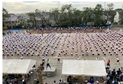
↑運動会 ↓ふれあい広場